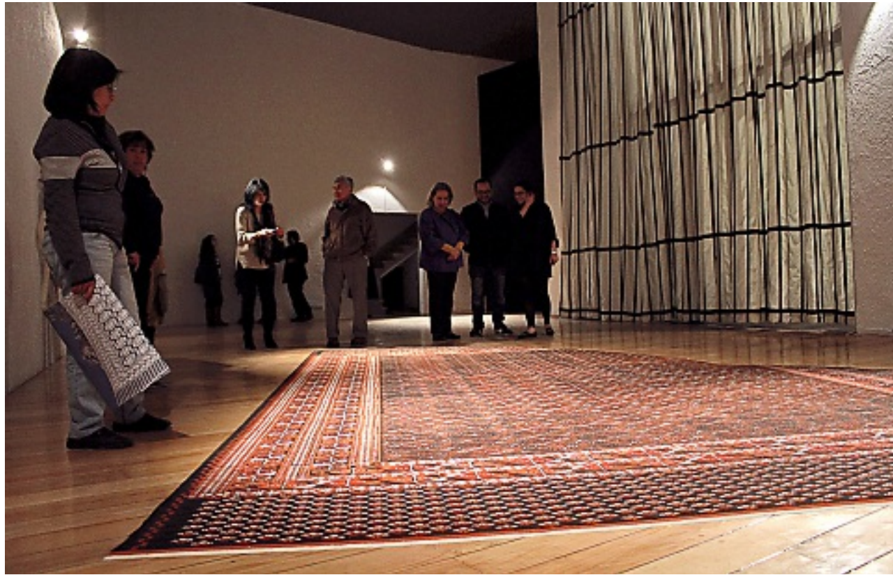
> "Intemperie", instalación de Vargas Lugo, consiste en una alfombra hecha de polvo de mármol y una cortina que simula barrotes.